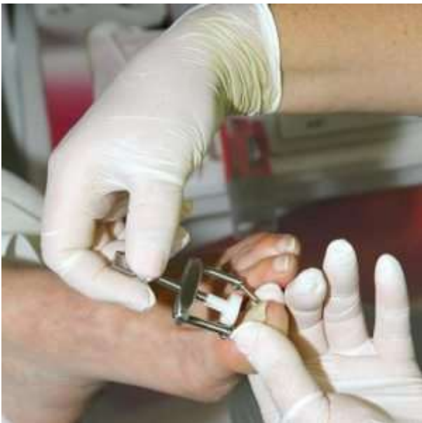
tourner doucement la roue

Les crochets sont placés sous le côté de l'ongle, après quoi vous abaissez la selle en tournant doucement et sans bruit de la roue. Dans ce processus, toujours rester en contact avec votre client.