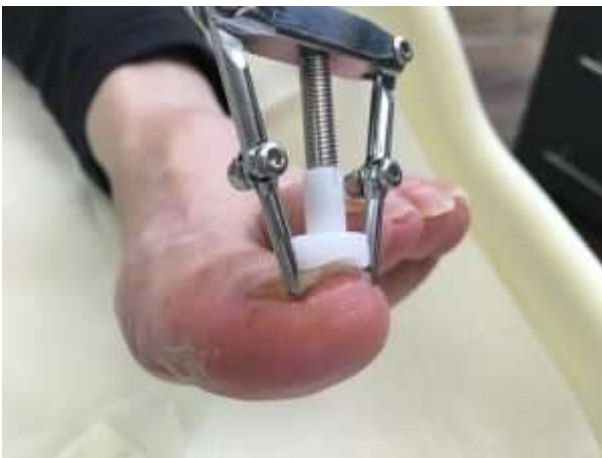
procès- de levage

L'instrument est un appareil pour traiter les ongles incarnés / incarnés. Le Naillift possède 2 crochets pour soulever le clou de sa paroi de l'ongle. Le positionnement de ces crochets sur le côté latéral et médial du bord de l'ongle et le serrage de la vis sur le capuchon crée une force de traction, ce qui amène les côtés de clous à être tiré vers le haut.