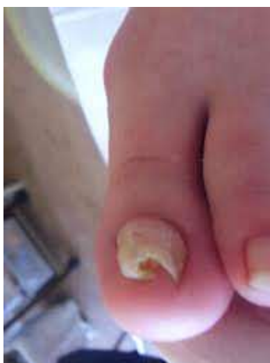
clou trompette / clou alambiquée

deux utile comme technique et un outil. Vous soulevez le clou pour qu'il / elle est sans pression et placer un support pour maintenir la position stimulée. vous pouvez faire un plan de traitement pour maintenir la position tous les 3 mois.