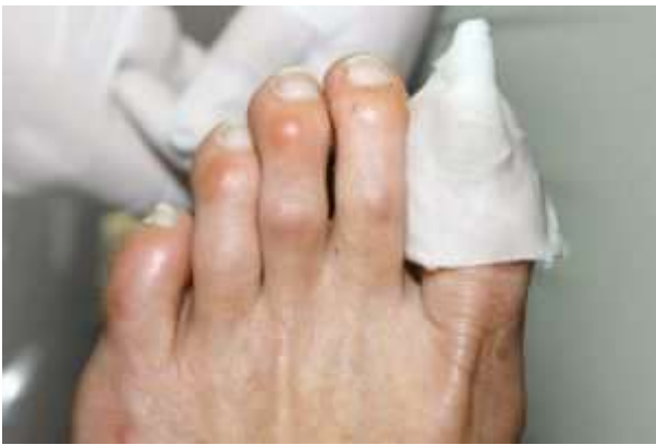
Faire tremper les ongles

Avant d'utiliser le Naillift vous devez préparer l'ongle à l'avance. S'il vous plaît ne pas couper l'ongle encore, nettoyez le mur de l'ongle.