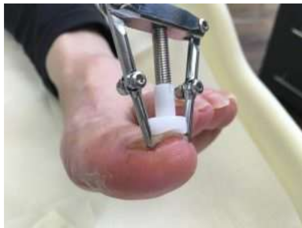
procès- de levage