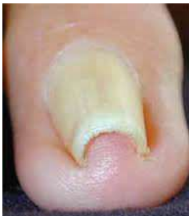
Pincer ongles / clou alambiquée

Quels clous peuvent être traités avec le Naillift: