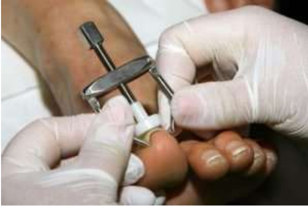
Crochets placés sous l'ongle

ascenseurs. Sur ce chemin, il n'y a aucune chance de l'apparition de onycholysis.